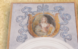
9 - Sibilla FRIGGIA