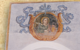
8 - Sibilla LESPONTICA