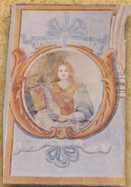
6 - Sibilla SAMIA