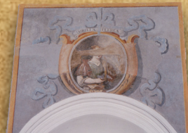
1 - Sibilla PERSICA