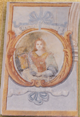
4 - Sibilla CUMEA