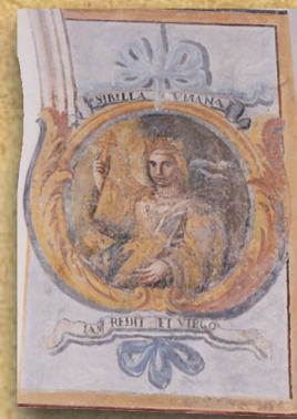
7 - Sibilla CUMANA