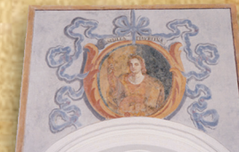
10 - Sibilla TIBURTINA