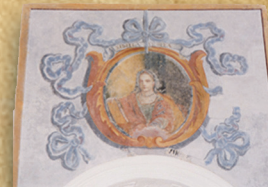
11 - Sibilla E(V)ROPEA