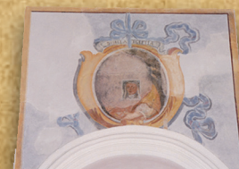
12 - Sibilla EGIPTIA