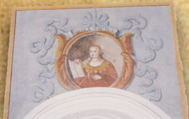
3 - Sibilla DELFICA