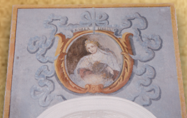
2 - Sibilla LIBICA