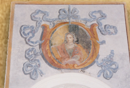
5 - Sibilla ERITREA